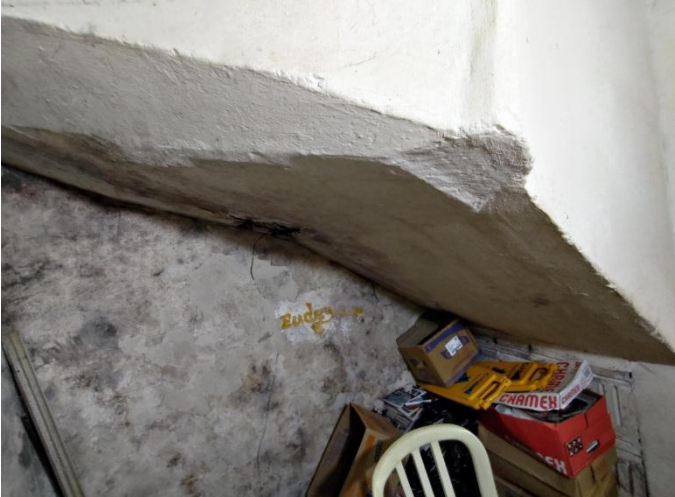
Figura 13. Vista inferior da escada secundária com danos pontuais que necessita de uma intervenção para recuperação. (29/08/2022)