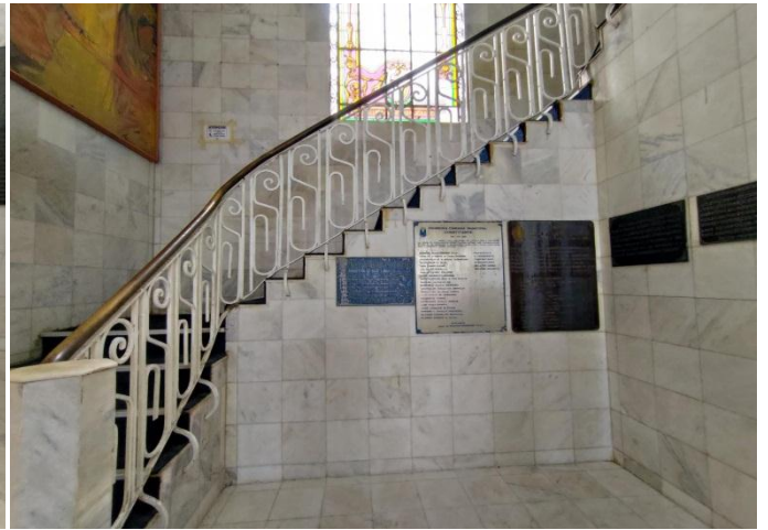
Figura 03. Vista da escada principal de acesso ao pavimento superior constituída em concreto ciclópico, com revestimento em pedra mármore e carpete. (29/08/2022)