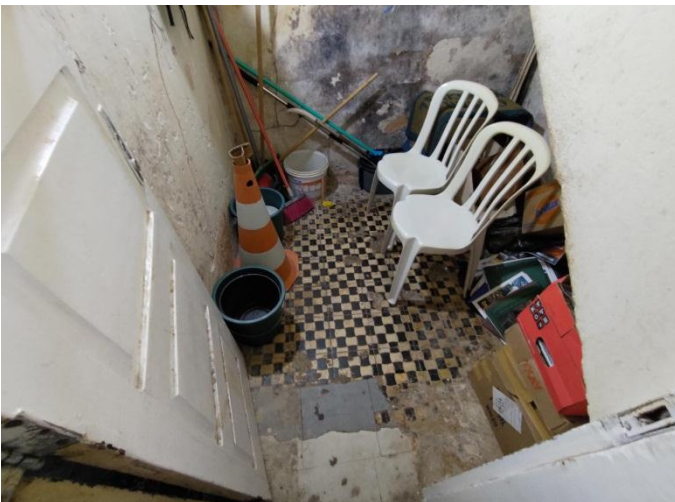
Figura 11. Vista do ambiente abaixo da escada secundária. (29/08/2022)