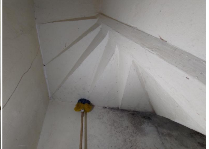
Figura 14. Vista do ambiente abaixo da escada secundária com paredes mofadas. (29/08/2022)