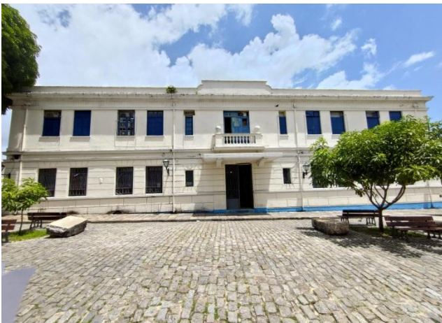
Figura 01. Vista da fachada voltada para a Rua da Estrela da Câmara Municipal de São Luís/MA. (29/08/2022)

Segue abaixo o relatório fotográfico que demonstra a atual situação constatada na vistoria do dia 29/08/2022: