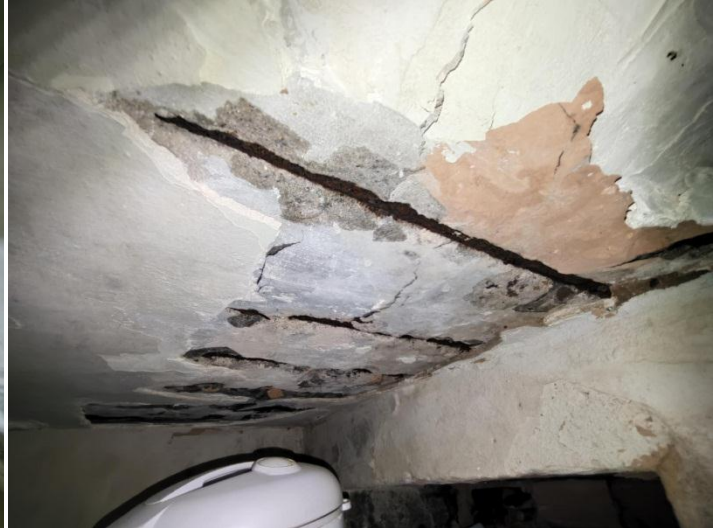
Figura 08. Vista inferior da escada principal com armaduras expostas e apresentando corrosão. 29/08/2022)