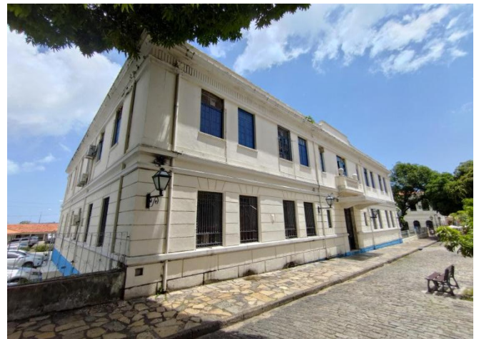
Figura 02. Vista do imóvel situado à Rua da Estrela, nº257, Qd. 103, Centro - São Luís/MA. (29/08/2022)