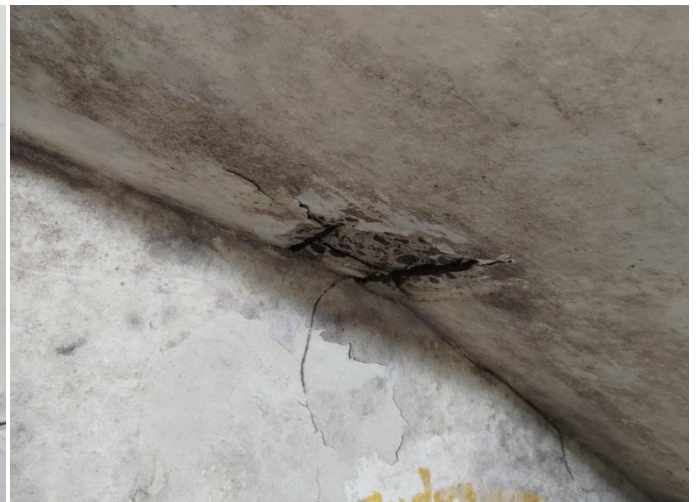
Figura 12. Detalhe de local abaixo da escada secundária com armaduras expostas e sofrendo corrosão e deslocamento do recobrimento. (29/08/2022)