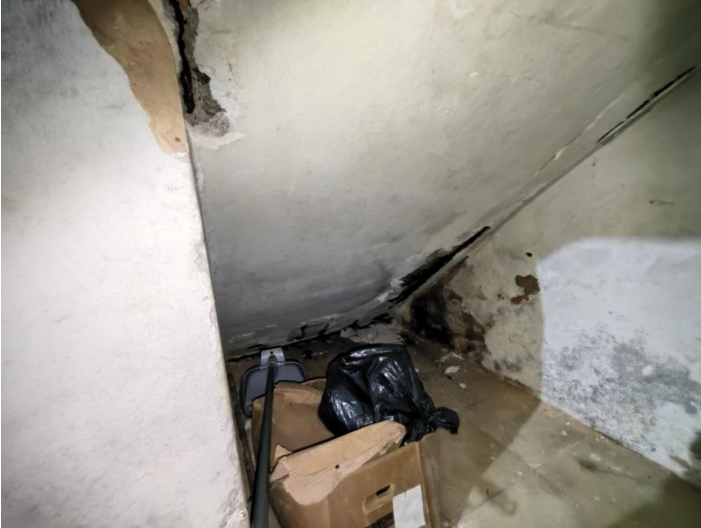
Figura 07. Vista inferior da escada principal com danos na argamassa de recobrimento e armaduras expostas com corrosão. (29/08/2022)