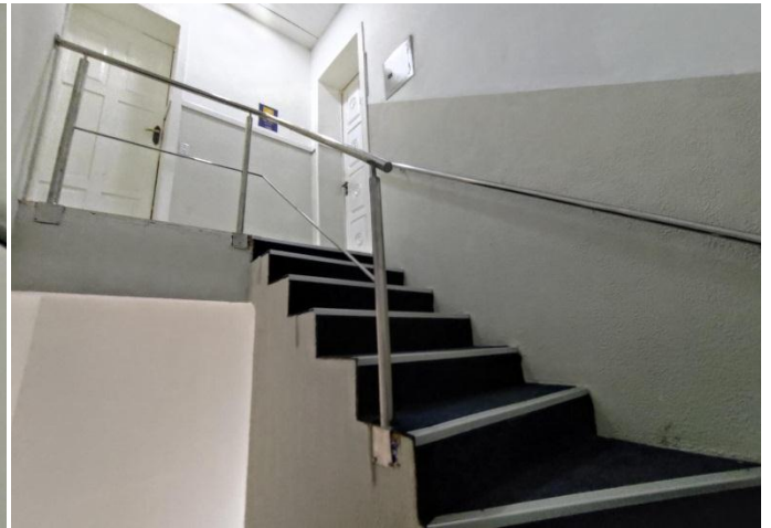
Figura 10. Vista da escada secundária que dá acesso à presidência. (29/08/2022)