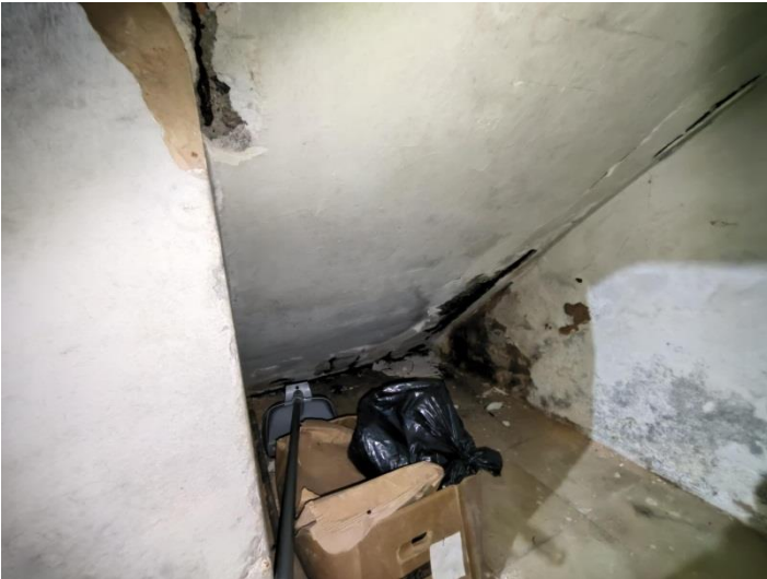
Figura 07. Vista inferior da escada principal com danos na argamassa de recobrimento e armaduras expostas com corrosão. (29/08/2022)