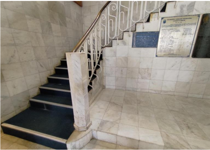
Figura 03. Vista da escada principal de acesso ao pavimento superior constituída em concreto ciclópico, com revestimento em pedra mármore e carpete. (29/08/2022)