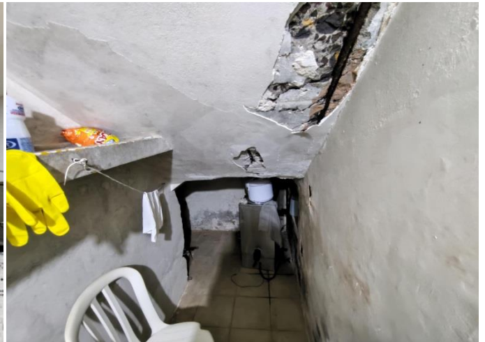
Figura 06. Vista inferior da escada principal com armaduras expostas e sofrendo corrosão, além do deslocamento do recobrimento. (29/08/2022)